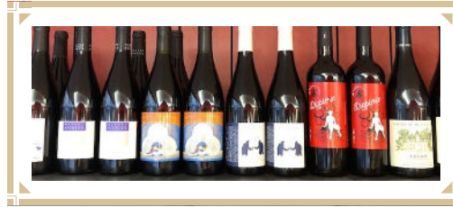
Notre épicerie fine et vin BIO