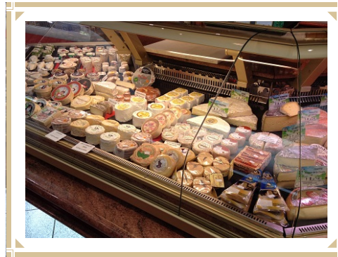
Notre rayon fromages

Commande minimum en Traiteur ou Menus : 2 personnes